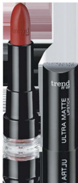
Urejata: Sonja Javornik; foto: arhiv proizvajalcev, osebni arhiv